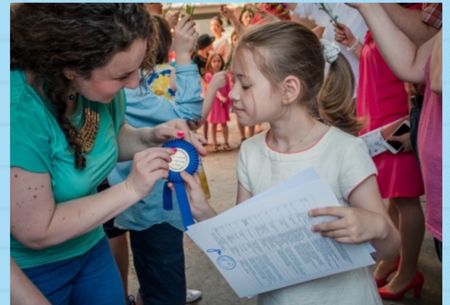
Graduare Școala de Excelență (program de weekend)