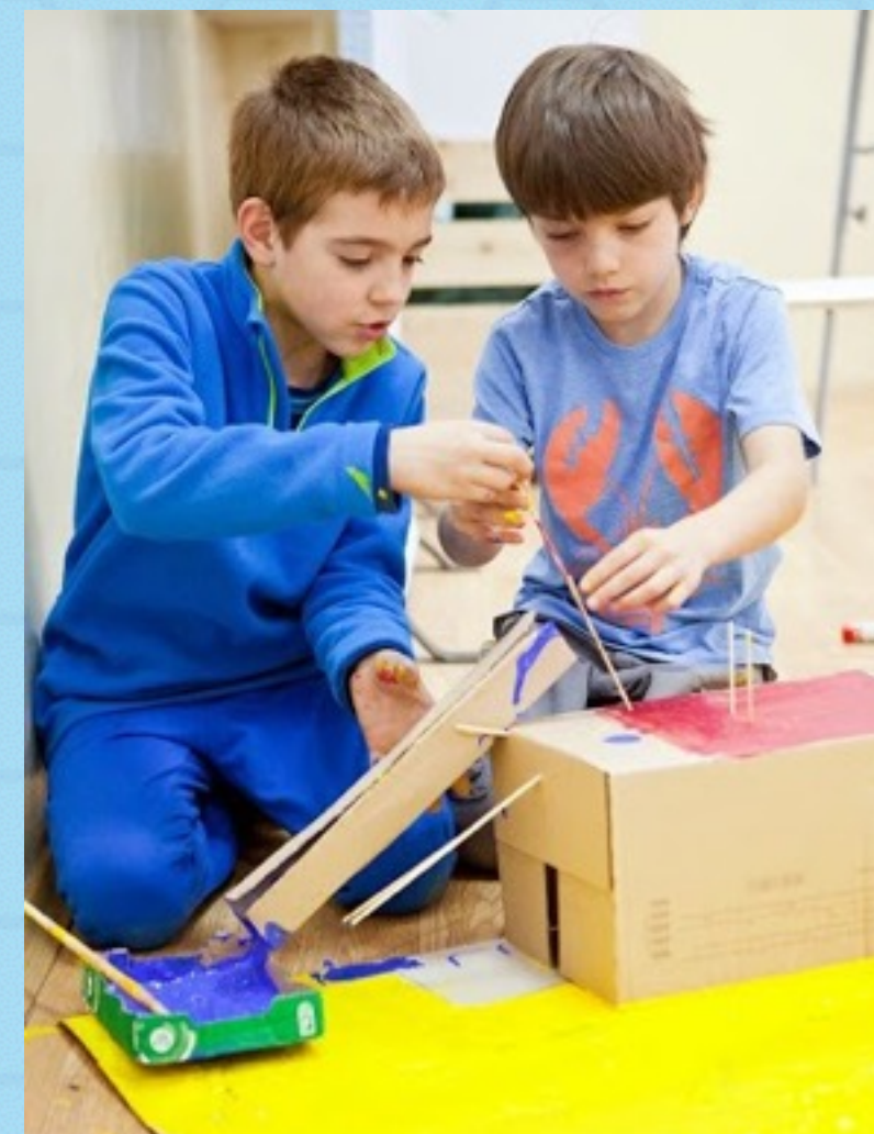
Bright Summer Program